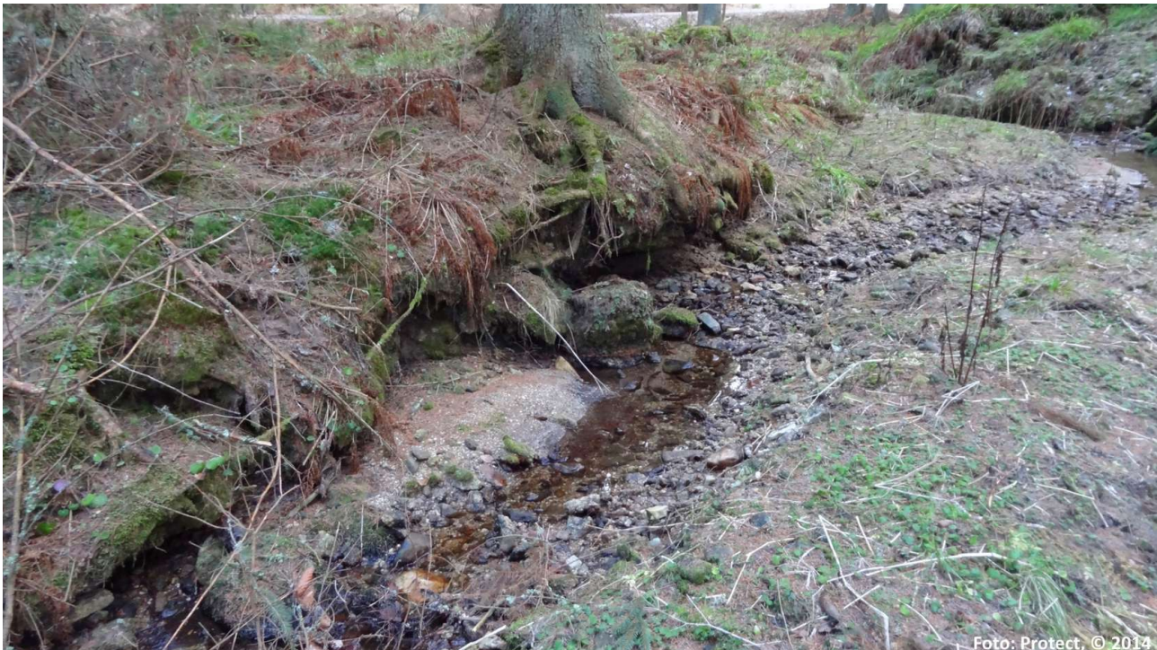
Abb. 3: Der Einsiedelbach im Januar 2014 etwa 400 m unterhalb der Wasserentnahmestelle für die technische Beschneidung.

Die schwerwiegenden Folgen von künstlicher Beschneidung und Übersandung von Fließgewässern auf die höchst gefährdeten, teilweise vom Aussterben bedrohten Arten sind auch in zahlreichen internationalen Studien bereits seit vielen Jahren immer wieder belegt worden.